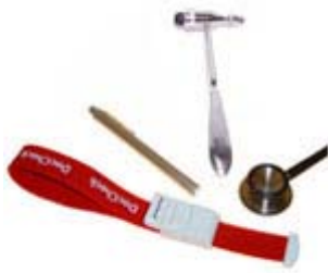
U-Kurs Set DocCheck Advance II