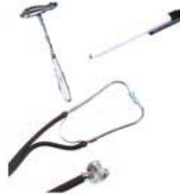
U-Kurs Set Best Value