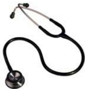
Stethoskop Littmann Classic II

Wer lieber praktische Dinge schenken möchte, kann Medizinstudenten oder frisch approbierte Ärzte auch mit einem Stethoskop (z.B. von Littmann oder DocCheck) beschenken. Ein Reflexhammer (z.B. Troemner) gehört genauso wie die Pupillenleuchte und der Stauschlauch zur Standardausrüstung eines Studenten und Arztes. Originell für Ärzte ist auch die Idee, einen kleinen Stempel zu machen, der Namen und Piepernummer enthält – somit lässt sich jede noch so unleserliche Unterschrift in den Unterlagen zuordnen. Die Preise der Geschenke in diesem Bereich schwanken sehr stark. Ein Littmann-Stethoskop schlägt mit rund 70 Euro zu Buche, während z.B. die Pupillenleuchte in der Regel unter 10 Euro zu haben ist.