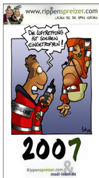
Rippenspreizer Kalender 2007

Natürlich lieben auch Mediziner den Humor, der manchmal ruhig auch ein wenig derber sein darf. Prominentes Beispiel ist Rippenspreizer.com – dort findet man neben 600 medizinischen Cartoons zahlreiche Geschenkmöglichkeiten für Weihnachten. Ob die eigene Cartoontasse, ein Jahreskalender mit speziellen Mediziner-cartoons oder die sogenannten Wahnsinnsplakate. Wer lieber im Kleidungsbereich auffallen möchte, findet bei Greenscrubs OP-Hauben und Kasaks mit bunten Mustern und in teilweise sehr schrägem Design – mit Sicherheit der Hingucker im OP und auf Station.