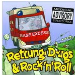
Base Excess CD 2