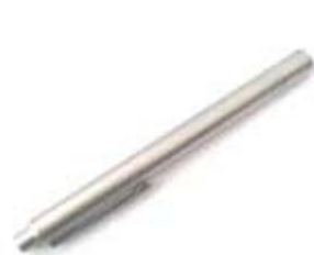
DocCheck Penlight Pupillenleuchte