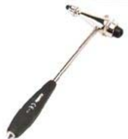
Reflexhammer nach TROEMNER