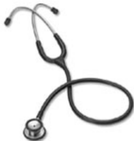
Stethoskop DC Advance II