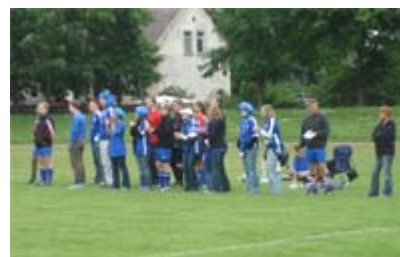
Das Outfit der Fans ist ebenso wichtig