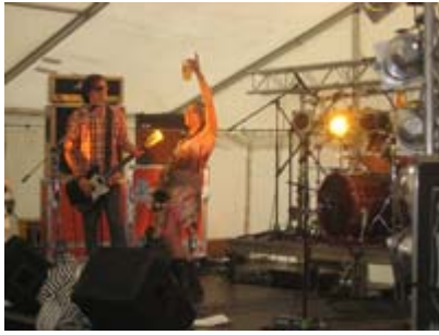
Die große Begrüßungsparty