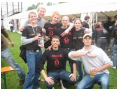
Gute Laune steht im Vordergrund

Die Veranstaltung beginnt am Freitagabend bereits mit einer Begrüßungsparty und der Vorstellung der Teilnehmer. Am Samstag finden der Wettkampf und die Siegerehrung statt. Am Sonntag gehts zurück nach Hause. Jede Uni darf je ein bis zwei Männer- und Frauenmannschaften stellen. Gespielt wird auf Kleinfeldern in Mannschaften von je fünf Personen. Ein Spiel dauert 12 Minuten. Mindestens genauso wichtig wie das Turnier selbst ist der Fancontest. Die Bewertungskriterien hierbei sind unter anderem die Anzahl der Fans, deren Outfit und Fanutensilien. Anreisen lohnt sich auf jeden Fall, denn die Veranstalter garantieren eine riesen Stimmung.