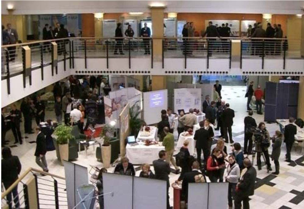
36 Aussteller erwarten die Besucher auf der Mediziner-Jobmesse „Clinic Connect“ (hier ein Bild von 2009)