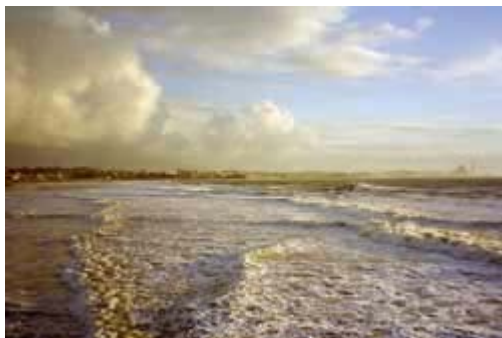
Küste von New Plymouth