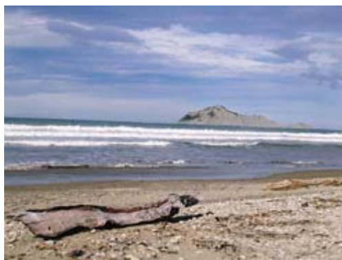
Die Ostküste von Neuseeland