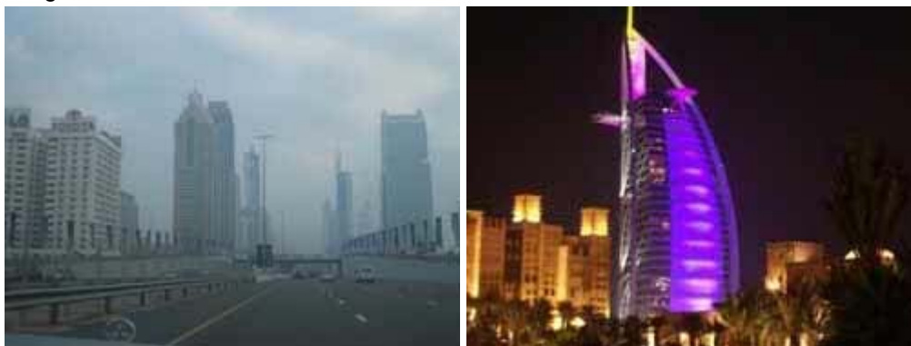
Neujahr in Dubai

Am Mittag des Neujahrstages bestiegen wir unseren Flieger. Ich hatte 16 Stunden Aufenthalt in Dubai. Bextar, eine der jungen Damen, die wir in Sri Lanka kennen gelernt hatten, holte uns vom Flughafen ab und begrüßte uns überschwänglich. In ihrem Jeep machten wir erstmal eine kleine Stadtrundfahrt durch die Stadt des unbegrenzten Kapitalismus. Überall sahen wir schrill schillernde Leuchtreklamen, zu beiden Seiten der vierspurigen Stadtautobahn schossen die Wolkenkratzer in die Höhe. Wir verbrachten einen schönen Abend, besuchten einen Jazzclub und versuchten die schrecklichen Bilder aus Sri Lanka zu verdrängen.