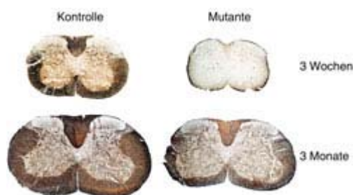
Abb. 2: Querschnitte des Rückenmarks von Mäusen, bei denen Myelin braun angefärbt wurde. In jungen mutanten Mäusen (rechts oben) ist sehr wenig Myelin nachzuweisen, während ältere Mutanten (rechts unten) erhebliche Mengen an Myelin gebildet haben. Links, zum Vergleich, jeweils Kontroll-Geschwistertiere mit normalen Myelin-Mengen in der weißen Substanz.

Das Gehirn hat hierbei eine Sonderstellung: Es synthetisiert sein gesamtes Cholesterin eigenständig und ist somit vollkommen unabhängig vom Cholesterinstoffwechsel des übrigen Körpers, also auch von der Nahrung. Überdies ist das Gehirn das cholesterinreichste Organ des menschlichen Körpers. Im Gehirn ist Cholesterin in den Nervenhiillen der weißen Substanz, die auch als Myelin bezeichnet werden, besonders stark angereichert. Myelin wird im zentralen Nervensystem von einem speziellen Zelltyp hergestellt, den so genannten Oligodendrozyten. Es entsteht vorwiegend während der ersten Lebenswochen. Myelin umhüllt als dicht gepackter Membranstapel Nervenfasern und bedingt so deren elektrische Isolation. Dies ermöglicht unter anderem eine effiziente Kontrolle der Körperhaltung, genauso wie es höhere Denkleistungen gewährleistet.